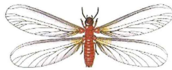
公益社団法人日本しろあり対策協会