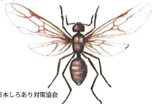
公益社団法人日本しろあり対策協会